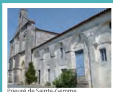
Prieuré de Sainte-Gemme