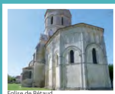
Église de Rétaud

Découverte des églises romanes de Thaims et Rétaud.