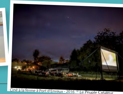
Ciné à la ferme à Port d'Envaux - 2016 - Le Peuple Créateur