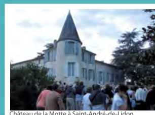
Château de la Motte à Saint-André-de-Lidon

> Rendez-vous à 20h30 au château de la Motte. Parcours fléché depuis le bourg. Gratuit.