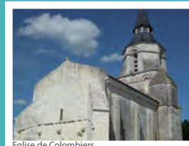
Eglise de Colombiers