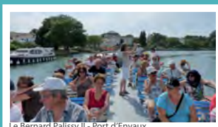
Le Bernard Palissy II - Port d'Envaux