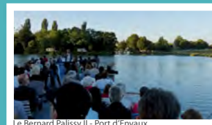
Le Bernard Palissy II - Port d'Envaux

Payant : 5 € adulte ; 2 € / - de 16 ans.