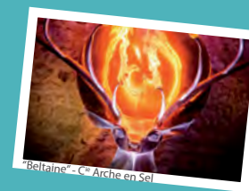
"Beltaine" - C ie Arche en Sel

> Rendez-vous à 20h30 devant l'église de Thaims, puis covoiturage, au cours de la visite, jusqu'à Rétaud. Gratuit.